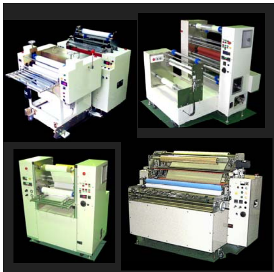
■既設装置に改造組込することも可能です。